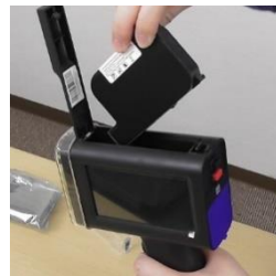
本体にカートリッジを差し込めば、すぐに使えます