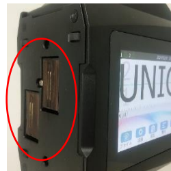
2インチは、1インチカートリッジを2個使います（連結部は印字がずれやすいのでご注意ください）