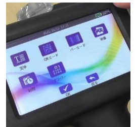
タッチパネルでレイアウトを編集し、文字、QR、バーコード、画像、時間、ナンバリングなど印字できます